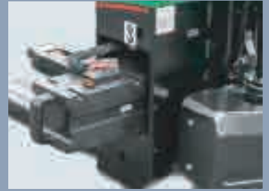
Changement de batterie simplifié