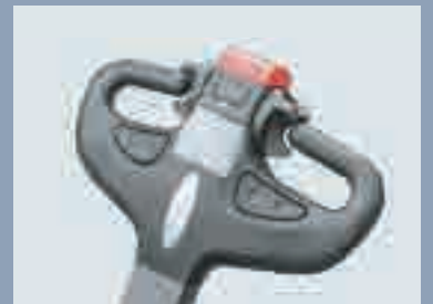
Le timon modulaire est simple mais fiable et esthétique. Toutes les pièces internes peuvent être remplacées séparément. Toutes les manœuvres peuvent être effectuées facilement avec une seule main.