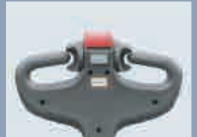
Le timon relevé permet d'utiliser les chariots dans des espaces confinés, tels que des conteneurs.