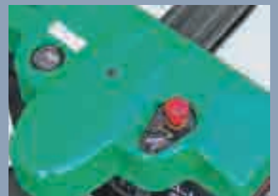
Les chariots présentent des lignes douces, une grande fluidité du mouvement, ainsi qu'un profil compact, conforme aux tendances les plus récentes en matière de design.