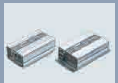
La compacité du chargeur facilite son transport.